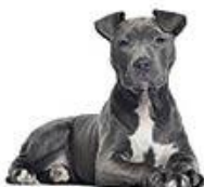
American Staffordshire Terrier